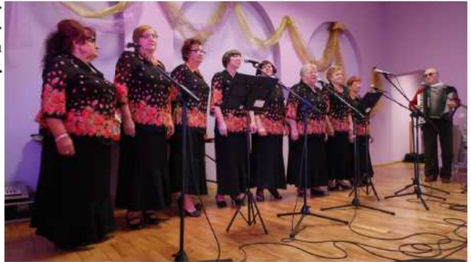
Jutrzenka, VI Powiatowy Festiwal Piosenki Biesiadnej, Lipinki Łużyckie, 20 kwietnia 2013 r.