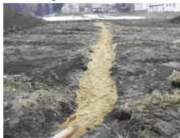
Zdjęcie przedstawia ułożony system drenażarski przed ułożeniem podbudowy.

równno w trakcie zajęć lekcyjnych, jak i w godzinach popołudniowych.