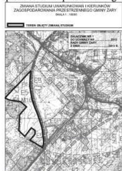
Rys. 2. Przystąpienie do opracowania zmiany Studium

Obszar wskazany do opracowania związany jest z planowaną realizacją programu mieszkaniowego na terenach, które w Studium przeznaczone zostały pod funkcje ekologiczne. Dla tego samego obszaru opracowany zostanie miejscowy plan zagospodarowania przestrzennego.